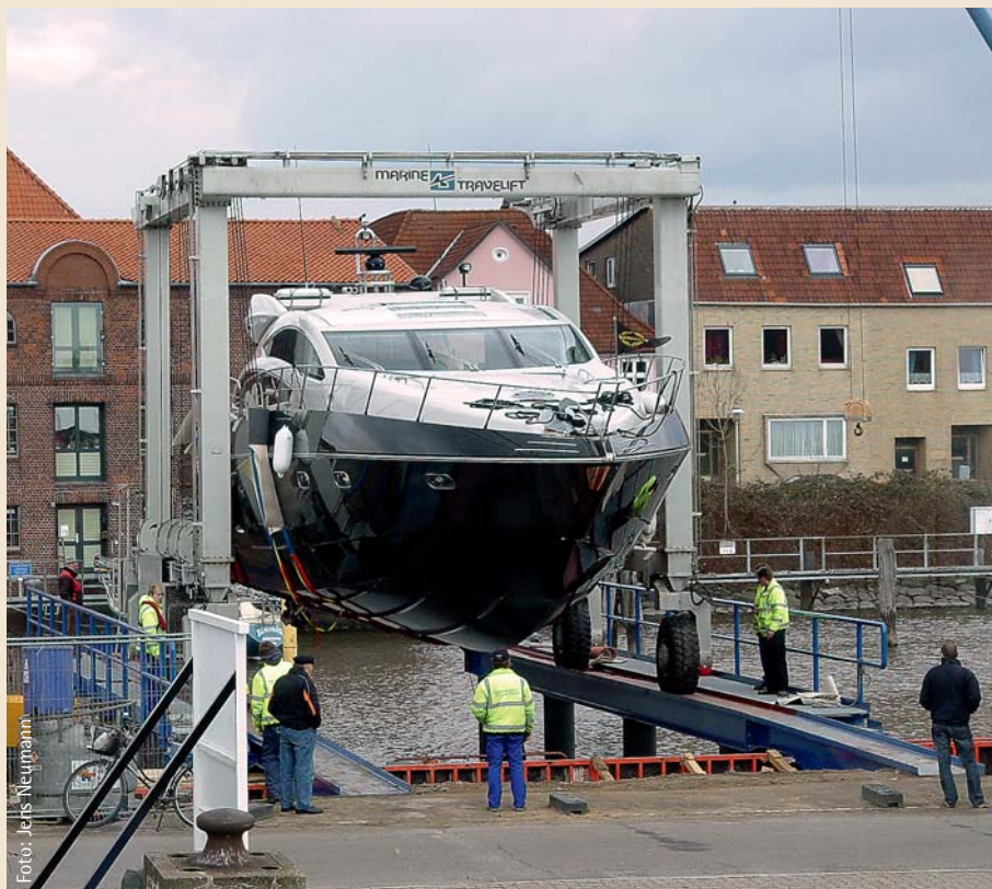
Bewährungsprobe bestanden: Der neue Travellift der Yachtwerft Glückstadt kann bis zu 50 Tonnen schwere Schiffe – hier eine Motoryacht vom Typ „Sunseeker Predator 74“ – aus dem Wasser heben.

Für die Yachtwerft ist der Travellift eine Investition in die Zukunft. „Wir rechnen damit, zusätzlich zum jetzigen Geschäft größere Yachten zu bekommen“, betont Falck. Zwei Ausbildungsplätze zum Bootsbauer hat der Betrieb mit 20 Mitarbeitern bereits neu geschaffen. Winterlager, Wartung und Reparatur sind die Hauptsäulen der Firma. So hat die Yachtwerft mit einem Jahresumsatz von knapp zwei Millionen Euro auch die weltweite Wirtschaftsflaute sicher umschiffen können. Falck: „Die Leute haben sich keine neuen Schiffe gekauft, sondern in ihre fahrenden Schiffe investiert.“ Jens Neumann