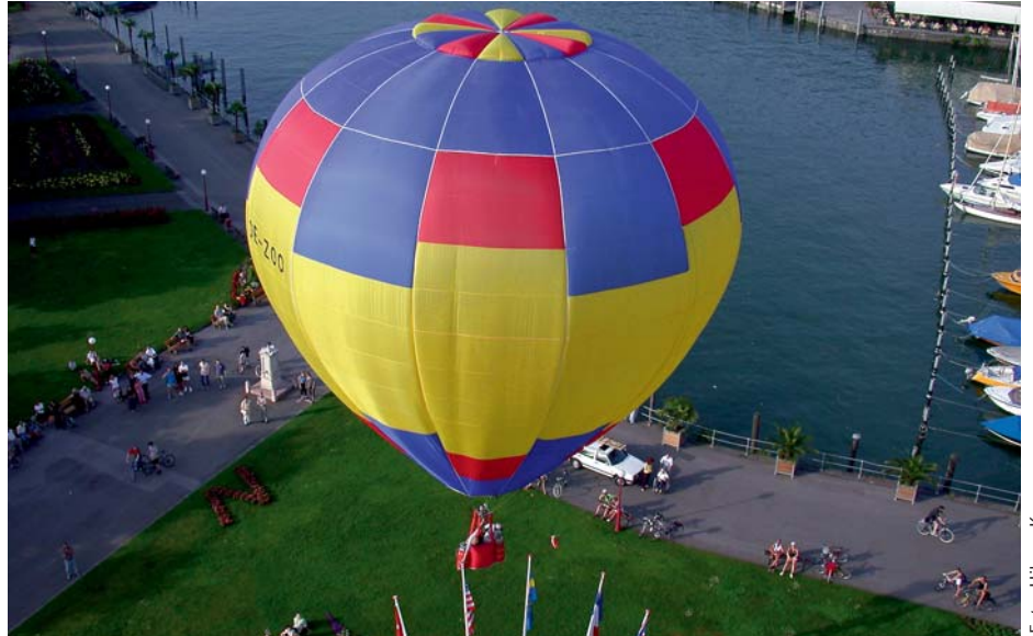
Deutschlands kleinster Heißluftballon kommt nach Kiel.