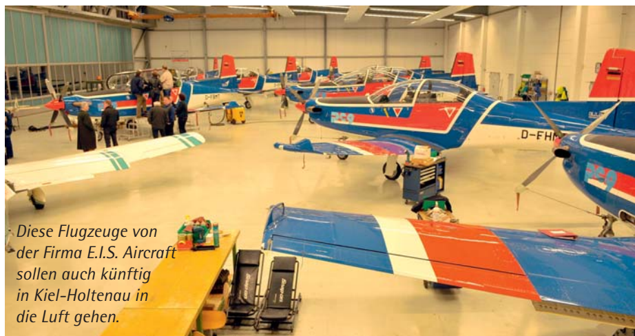
Diese Flugzeuge von der Firma E.I.S. Aircraft sollen auch künftig in Kiel-Holtenau in die Luft gehen.