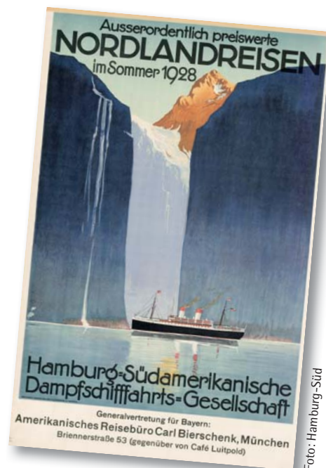
„Nordlandreise“, Plakat 1928.