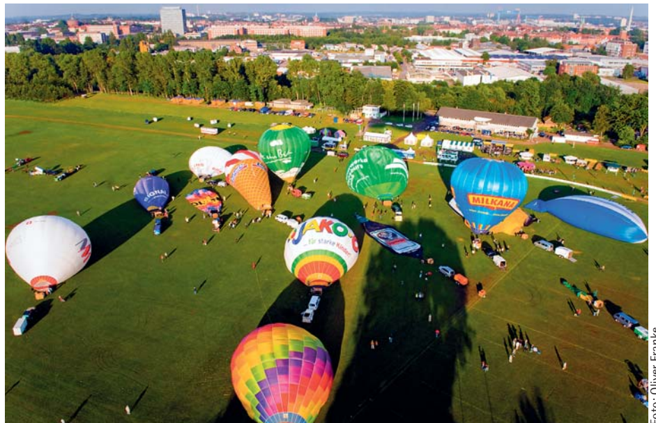
Die Balloon Sail ist auf der Kieler Woche neben den Segelschiffen der Hingucker schlechthin.

ken aus Rock und Klassik werden die Ballons anschließend zu einer einstudierten Choreographie im Takt befeuert und beginnen