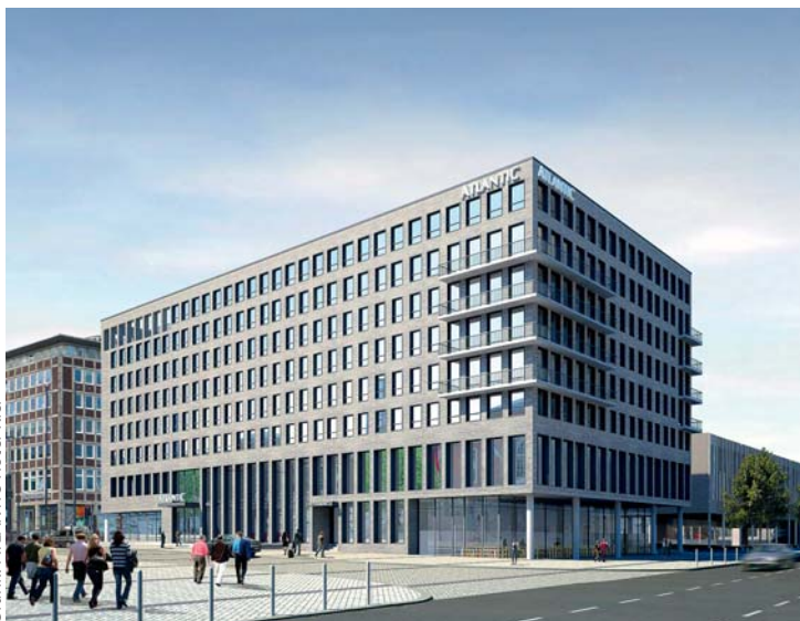
Grafik: ATLANTIC Hotel Kiel

sten ein einmaliges Wohn-, Genuss- und Spa-Erlebnis bieten. Mit dem Bau des von Giorgio Gullotta entworfenen ATLANTIC Hotels Kiel werden rund 75 Arbeitsplätze geschaffen. Generalunternehmer ist die Zechbau GmbH Niederlassung Hamburg. Das Investitionsvolumen beträgt knapp 30 Millionen Euro. jc